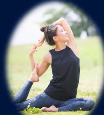
ヨガ・ピラティスインストラクター